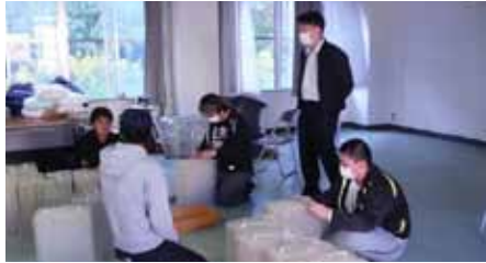
波板組み立てを体験

神奈川県が神奈川県漁業協同組合連合会に委託して行っている「2020年度かながわ漁業就業促進センター」の研修生三人が、昨年十月に当協会に研修に来ました。