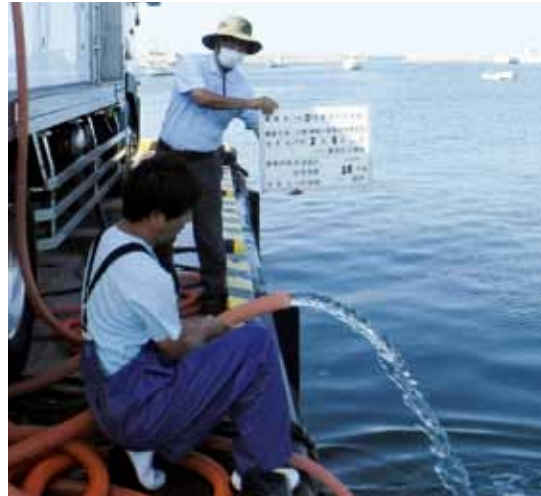
トラックで運び岸壁から放流

マダイの種苗生産の工程を今年度から変更しました。今までは、受精卵から全長20mmぐらいの大きさまで、陸上の40mの水槽で飼育していました。その後、三浦市にある小網代湾に浮かべた筏にモジ網を張って、全長六十mm以上になるまで育成し、四百トンの活魚運搬船で移送し、横浜市金沢区八景島沖から静岡県との境にある福浦まで十数か所に放流してきました。