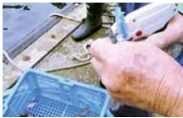
カワハギ稚魚に標識を付ける

また、同日、当協会が協力して、茅ヶ崎市漁協(三千尾)、江の島片瀬漁協(九千六百二十尾)のヒラメ種苗を放流していま